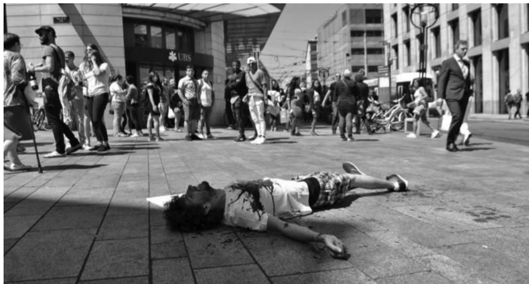
Action militante à Genève contre les affaires sanglantes des banques !

Par cette pression supplémentaire venant de leurs client-e-s, ainsi que la mise en place par notre initiative de conditions applicables aux banques et aux assurances, UBS et Crédit Suisse pourront suivre le chemin tracé par Publica et les autres caisses de pensions qui ont déjà décidé de ne plus investir dans ce commerce de la mort.