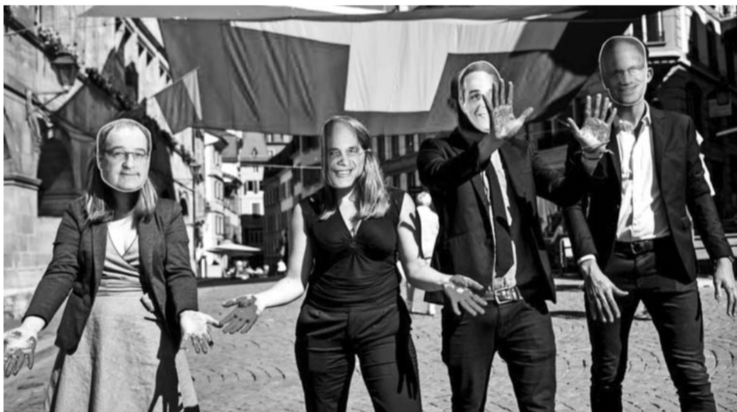
Le Conseil fédéral a du sang sur les mains ! Action du GSsA à Lausanne en juin dernier.

Au terme des différents processus parlementaires cantonaux, le Conseil fédéral aura été désavoué à plusieurs reprises quant à sa volonté d'assouplir l'OMG ! Il devra en tenir compte, au risque d'ignorer les appels de plusieurs organisations non gouvernementales, associations, partis et cantons !