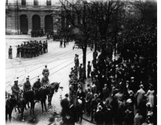
La cavalerie en action contre les manifestants sur la Paradeplatz de Zurich, 1918.

de trois jours en raison d'un dur ultimatum du Conseil fédéral, qui était prêt à accepter une guerre civile. Le fossé entre l'armée et la gauche était alors plus profond que jamais. Les actions militaires contre les grévistes et les opposants au nazisme se sont poursuivies dans la période qui suit 1918. Cinq travailleurs ont été abattus et plusieurs autres blessés lors de la grève générale de Bâle en 1919. Les opérations fréquentes menées par l'armée contre les rassemblements antinazis montrent à quel point l'armée était réactionnaire. Le 9 novembre 1932, 13 antifascistes furent fusillés et 65 blessés dans un rassemblement à Genève. Parmi les morts, il y avait un père dont le fils a dû tirer en tant que recrue.