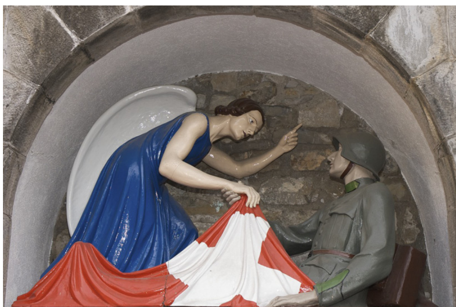
Soldat avec ange

4 Groupe country-rock féminin Américain (Texan) ayant connu une campagne massive de dénigrement pour avoir critiqué Georges W. Bush avant l'invasion de l'Irak. Episode relaté dans le film «shut up and sing».