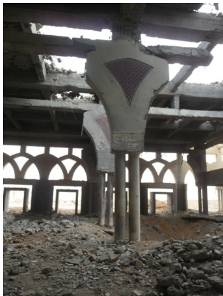
Le blocus israélien empêche la reconstruction.

velles idées. La Suisse ne peut faire aucun compromis dans la question du droit international humanitaire. Le Palais fédéral doit rester ferme face aux très fortes pressions de la part des Etats-Unis et d'Israël. Le Conseil fédéral doit savoir qu'on peut gagner le soutien de la population suisse pour ce rôle indépendant et humanitaire de la Suisse en faveur de personnes qui souffrent.