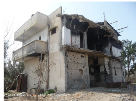
L'opération «Plomb durci» de décembre-janvier 2008/9 a détruit ou endommagé les habitations de 72'000 habitants de la Bande de Gaza.

Toutes les organisations de droits humains israéliennes et palestiniennes, ainsi que beaucoup d'autres défenseurs du droit international humanitaire dans le monde ont de très grandes attentes par rapport à la Suisse. 3 C'est un devoir hautement respectable pour notre pays que de prêter écoute à ces voix et de tout mettre en œuvre pour réaliser une conférence préparée professionnellement et efficace pour l'application du droit international humanitaire dans les territoires palestiniens occupés. Celle-ci doit traiter les obligations de la communauté internationale des États et permettre de développer de nou-