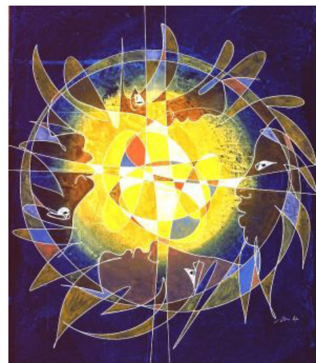
Paceminterris (Hans Erni)

La définition de la paix apporte quelques éclaircissements supplémentaires: on peut dire de la paix qu'elle a deux zones. Une zone centrale, parfois ineffable (difficile à décrire, faite pour être vécue), zone faite d'harmonie et de bonheur de vivre. Et une zone plus frontalière où la paix se construit, où le conflit se prévient ou se résout sans trahir l'idéal de paix. Les deux zones demandent un suivi et une technique pour être mises en œuvre. Elles sont complémentaires, contiguës, parfois interpénétrables. Pour faire de la paix ou de l'art une dynamique vivante et épanouissante, les deux zones ont une part