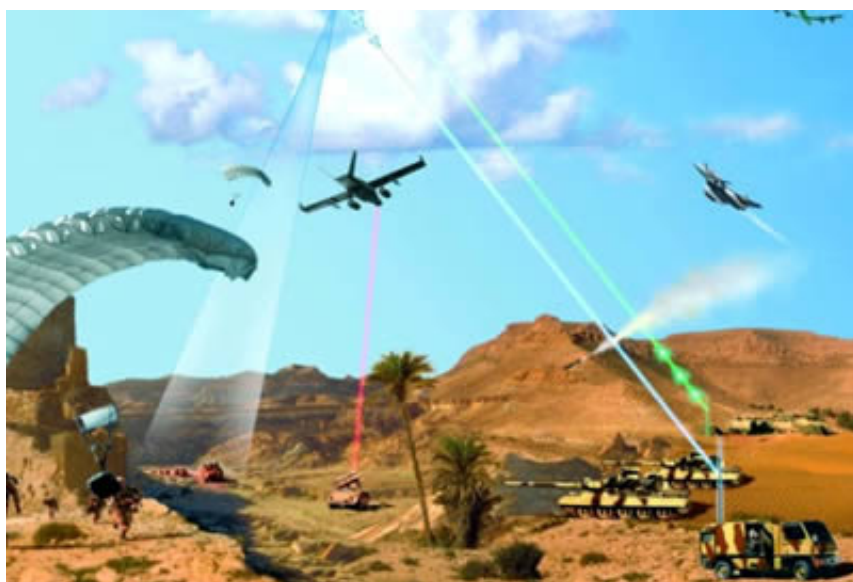
Exemple d'utilisation de drones militaires

Voir à ce sujet le dossier du Monde diplomatique, repris dans Le Courrier du 12 décembre 2009, et aussi, beaucoup moins critique: http://www.onera.fr/conferences/drones/drones-militaires.php